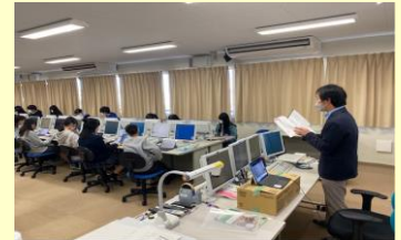
パソコン室「プログラミングの入門」授業